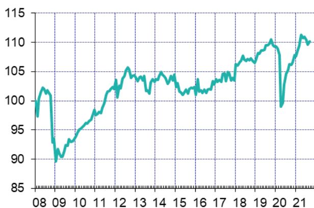
Оценка ВВП, январь 2008 = 100 с исключением сезонности