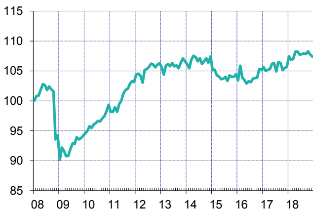
Оценка ВВП, январь 2008 = 100 с исключением сезонности